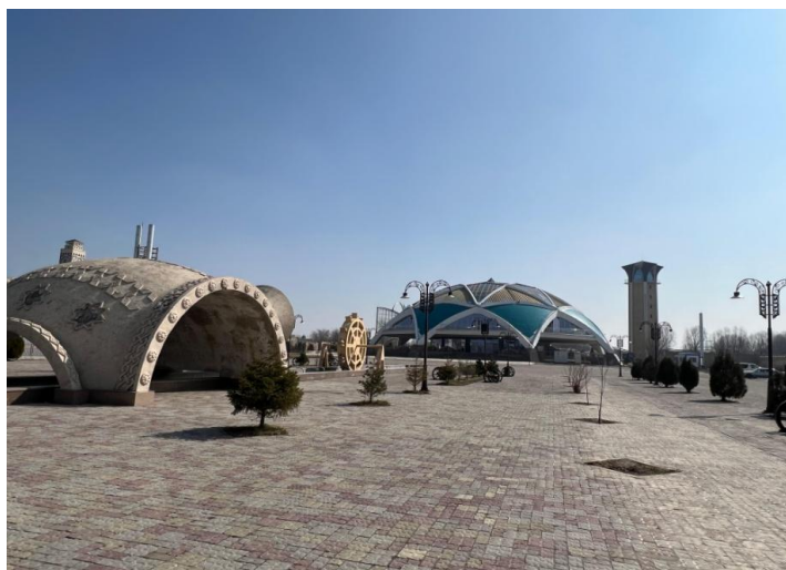
Рисунок 4 – Археологический парк Древний Тараз

Этот комплекс общей площадью около 10 га получил сегодня официальное название - археологический парк "Древний Тараз" представлен на рисунке 4. Он стал не только новым объектом историко-культурного и природного туризма края, но и настоящим музеем под открытым небом.