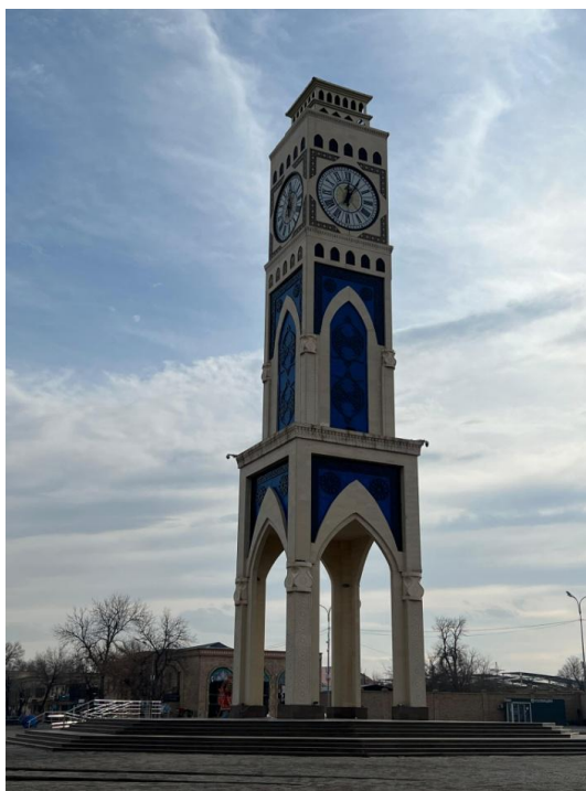
Рисунок 7 – Стелла «Сағат»