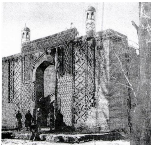
Рисунок 12 – Мавзолей Карахана 120 лет назад