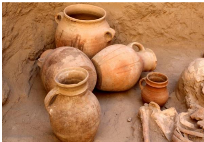
Рисунок 2 – Артефакты, найденные на базе Древнего Тараза

В 2011 году на территории бывшего Центрального рынка города Тараз, или как его в народе называют "Зеленый рынок", начались интенсивные археологические раскопки, ежегодно дающие удивительные результаты и уникальные находки. Всего в ходе научно-исследовательских работ на базе городка "Коне-Тараз" было обнаружено более 33 000 артефактов представлены на рисунке 2, около 100 из них найдены целыми [10].