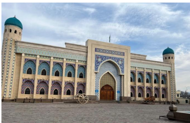
Рисунок 6 – «Областной историко-краеведческий музей»