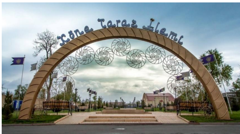
Рисунок 1 – Историко-культурный центр «Древний Тараз»

В городе много исторических мест. Это мавзолей Карахана, мавзолей Бабаджа хатун, могила Айша биби, дворцовый комплекс Акыртас. Эти мавзолеи и исторические места находятся за пределами города. Среди них 580-метровая пешеходная аллея, этно-исторический комплекс "Тектурмас" и историко-этнокультурный комплекс "Коне-Тараз" (рисунок 1).