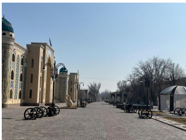
Рисунок 9 – Арбат