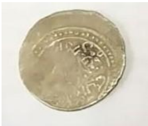
Рисунок 3 – Золотая монета, найденная при раскопках

менее интересными артефактами. Среди прочего особое место занимает керамический узор с изображением ловко наездника и животных. Как предполагают ученые, узор может служить шаблоном для изготовления плитки.