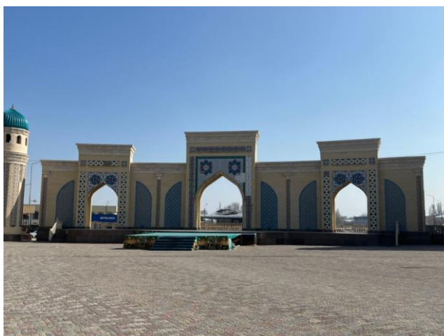
Рисунок 8 – Амфитеатр «Ретро-фестиваль»