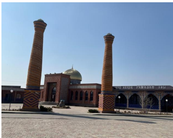
Рисунок 10 – Комплекс мечети

На сегодняшний день полностью завершены строительно-монтажные, отделочные работы по всем объектам комплекса. Отделочные работы выполнены в соответствии с проведенной инфраструктурой из кирпича в Самаркандском стиле. Строительные работы в центре площадью около семи гектаров начались в июне 2020 года и были завершены в декабре. А также внешняя отделка каждого здания-ход отделки уникален. Однако следует отметить, что во всех работах по оформлению объекта в комплексе использованы восьмиугольные узоры-рельефы, встречающиеся в мавзолее Айша биби. Он позволяет комплексу формировать средневековый облик города Тараз и оказывает особое влияние на посетителей. Была традиция возводить «Дом для будущей жизни» на вершине могилы людей, известных своей архитектурой эпохи Караханидов. В этот период мемориальная архитектура рассматриваемого Казахстана приобрела новый вид мавзолеев. К уже известным башенным мавзолеям был добавлен ряд новых – барабанных или центристских мавзолеев с шаровидными и кровельными покрытиями.